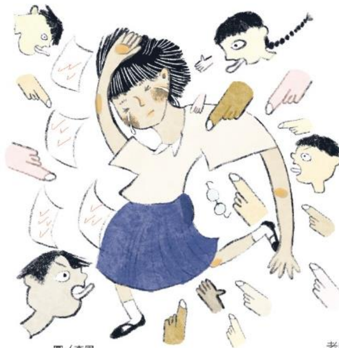
圖 / 李恩

常言道：「說者無心，聽者有意。」只是說者全然無辜，純粹是聽者想太多了嗎？就你的困擾